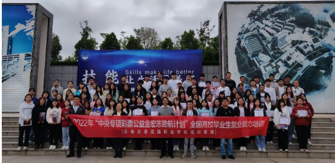
图 1：学校组织开展“宏志助航计划”职业能力提升培训