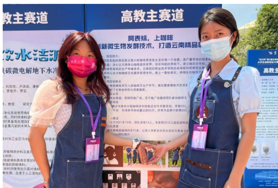
图 2：“阿表妹，上咖啡创新微生物发酵技术，打造云南精品咖啡”获银奖

学校将立足国家创新驱动发展战略，全力打造创新创业与学科建设融合、创新创业与人才培养融合、创新创业与思政教育融合的特色双创教育体系，致力培养爱党爱国，勇于担当民族复兴重任的高素质创新型人才。